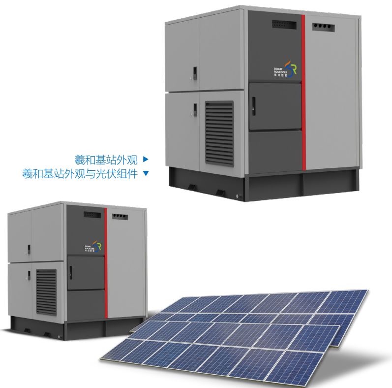
羲和基站外观 ▶ 羲和基站外观与光伏组件 ▼